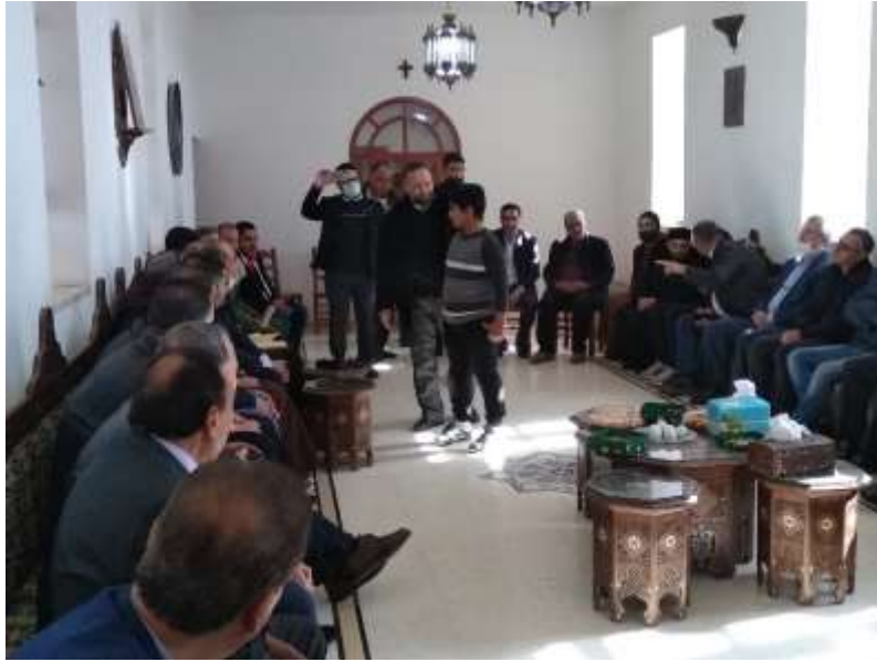
Bezoek van de gouverneur van Qalamoun: Mootaz Joumrane