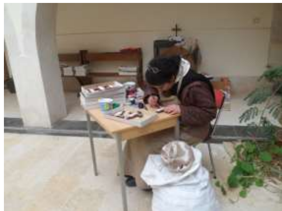
Nog steeds: kruisjes schilderen